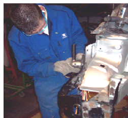
Réparation des Carrosseries